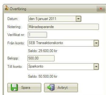
Fönster för att bokföra en överföring

I vissa fall kan ett fönster öppnas där man exempelvis bokför en utgift, konfigurerar kontoplan eller registrerar en skuld. Detta fönster öppnas centrerat i programmets huvudfönster.