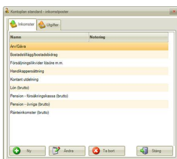
Fönster som visar kontoplan (inkomst och utgifter)